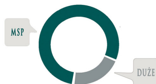
ZATRUDNIENIE W POLSKICH PRZEDSIĘBIORSTWACH

Ogółem przedsiębiorstwa w Polsce wytwarzają blisko trzy czwarte produktu krajowego brutto (71,8%), z czego duże przedsiębiorstwa wytwarzają 24,5%. Z tej statystyki wynika, że sektor małych i średnich przedsiębiorstw wytwarza aż 47,3% polskiego PKB, co ilustruje poniższy wykres.