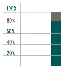
UDZIAŁ POLSKICH PRZEDSIĘBIORSTW W EKSPORCIE

Z analizy wynika, że mali i średni przedsiębiorcy stanowią blisko 90% (dokładnie 87,8%) ogółu eksporterów. Istotnym wydaje się być fakt, że zaledwie 29,5% małych i średnich przedsiębiorstw zajmuje się eksportem. W związku z tym należy wysnuć wniosek, że 29,5% małych i średnich przedsiębiorstw stanowi 87,8% ogółu polskich eksporterów.